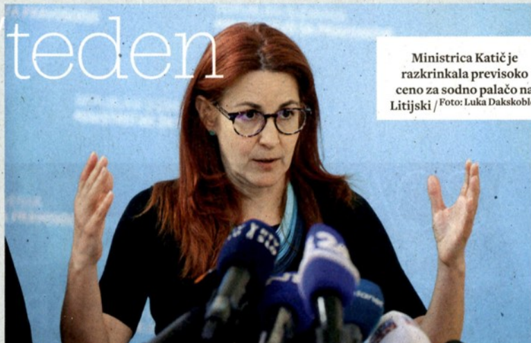
Ministrica Katič je razkrinkala previsoko ceno za sodno palačo na Litijski

Predstavniki sindikatov Mladi plus in Zasuk, društva Iskra ter Centra za družbeno raziskovanje – Cedra ocenjujejo, da ob mednarodnem prazniku dela, 1. maju, ni več razlogov za praznovanje, zato so v središču Ljubljane organizirali protest, ki ga delavstvo danes potrebuje veliko bolj od glasbe in golaža. Kot so njihovi predstavniki opozorili že na predhodni tiskovni konferenci, se položaj delavk in delavcev vztrajno poslabšuje. »Na delovnih mestih se izkoriščanje stopnjuje, produktivnost se povečuje, število ur, ki smo jih