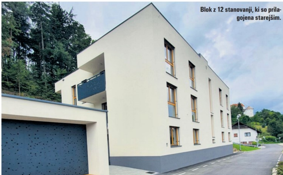
Blok z 12 stanovanji, ki so prilagojena starejšim.

Tudi v lanskem proračunu je velenjska mestna občina nekaj milijonov evrov zagotovila za izboljšanje javne komunalne infrastrukture ter zagotavljanje trajnostne oskrbe. Stroški za izboljšanje oskrbe s toplotno energijo so v lanskem letu znašali skoraj 1,4 milijona evrov. Obnovila je sekundarni toplovod na Goriški cesti, pridobila dokumentacijo za prehod z daljinskega ogrevanja na obnovljive vire in opravila delno sanacijo omrežja. Skoraj 300.000 evrov je porabila za nadgradnjo kanalizacijskega sistema v naselju Vinska Gora. Tako se je na javno kanalizacijsko omrežje lahko priključilo 34 gospodinjstev v zaselkih Podvine in Vinska Gora. Kot je še razvidno iz občinskega poročila, je MOV skoraj 3 milijone evrov namenila za izvedbo nujnih obnovitvenih del na magistralnem vodovodu in zajetju Ljubija, ki ga je lanska avgustovska ujma močno prizadela. Skoraj 200.000 evrov je stala gradnja pločnika ob Ljubljanski cesti. V mestnem središču na Šaleški in Rudarski cesti je uredila podzemne zbiralnice, za kar je odštela več kot 242.000 evrov.