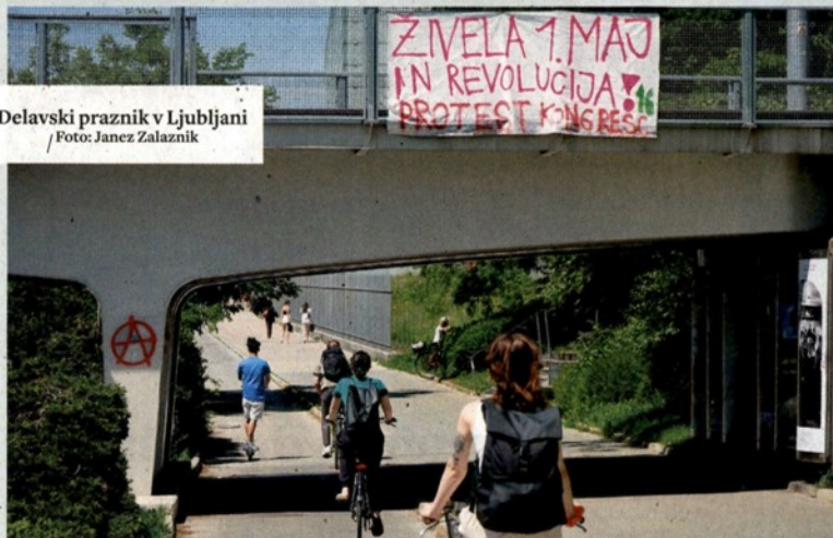
Delavski praznik v Ljubljani