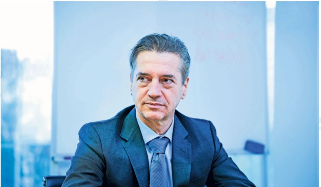
OECD že več let priporoča Sloveniji uvedbo nepremičninskega davka in predlaga nižjo obdavčitev dela. Smernice za davčne spremembe ne prinašajo nič od tega.

spodbude za nagrajevanje v start-upih ter spodbude za privabljanje ključnega kadra. Ideja je, da bi jih po zgledu Španije in Portugalske oprostili plačila dohodnine oziroma jo omejili s 50 na največ 35 odstotkov davčne stopnje za tiste ključne kadre, ki bi se bili po desetih letih pripravljene vrniti v Slovenijo. S to dohodninsko spremembo bi radi spodbudili tudi zaposlovanje diplomantov tujih fakultet.